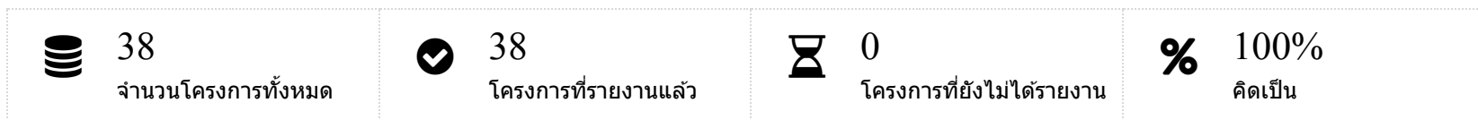
กราฟแสดงภาพรวมโครงการ